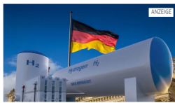
ERFOLGSANLEGER 2 Wasserstoff-Aktien vor Ausbruch