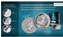
MDM DEUTSCHE MÜNZE Die 15 wichtigsten Silbermünzen aus reinem...