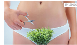
IM ÜBERBLICK 5 angesagte Intimfrisuren für Frauen