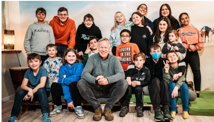
Johannes B. Kerner ist positiv überrascht, wie aufgeweckt die Kinder im Schutzengelhaus sind

Die BILD-Hilfsorganisation „Ein Herz für Kinder“ möchte die Einrichtung unterstützen