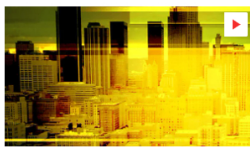
CORONA-HÖLLE IN DER STADT DER ENGEL Corona-Hölle in der Stadt der Engel - Wie Deutsche in L.A. die...