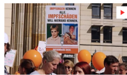
CHRONISCHE FEHLEINSCHÄTZUNG Chronische Fehleinschätzung - Die kranke Welt der Impfgegner