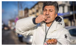
LOTTO-MILLIONÄR RECHNET MIT RIESEN-DEAL NUSS das sein, Chico?