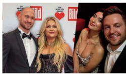
„EIN HERZ FÜR KINDER“ Pärchen-Premiere! „Ich bin nervöser als er“