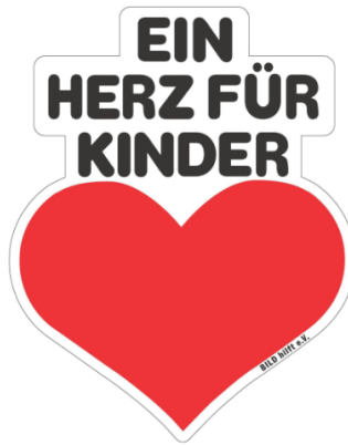
Die BILD-Hilfsorganisation „Ein Herz für Kinder“ setzt sich weltweit für Kinder ein