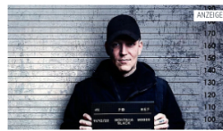
JOYN Twitcher im Knast: GET AWAY! von MontanaBlack