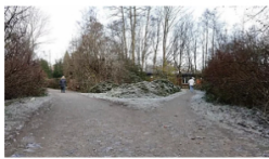
ER WOLLTE SICH MIT MÄDCHEN (15) ZUM SEX TREFFEN Jugendliche prügeln Mann (61) fast zu Tode