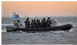
SCHOLZ ERÖFFNET ERSTES LNG-TERMINAL Raten Sie mal, wer unser Flüssiggas schützt